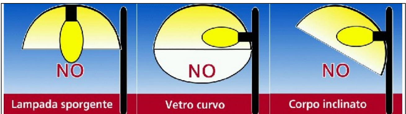
Figura 1 – Tipologie di apparecchi non ammessi dalla Lr17/09

a) sono costituiti da apparecchi illuminanti, aventi un'intensità luminosa massima fra 0 e 0,49 cd per 1.000 lumen a 90° e oltre;