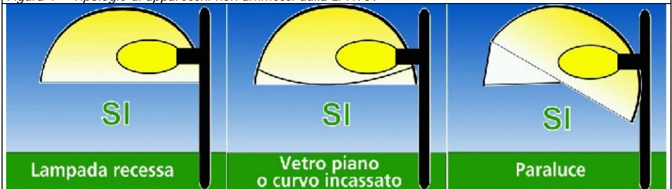
Figura 2 – Tipologie di apparecchi conformi alla legge n. 17/09

L' Intensità luminosa ( I ) esprime la quantità di luce che è emessa da una sorgente (flusso luminoso) in una determinata direzione (angolo \gamma ). Essendo una grandezza di tipo vettoriale per esprimerla correttamente non basta indicare la quantità di luce ma occorre specificare la direzione ad essa associata. Per permettere i necessari confronti viene “normalizzata” per 1000 lumen. L'unità di misura è la candela (cd).